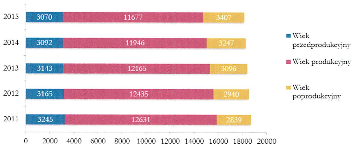
Wykres 2. Liczba ludności według kategorii wiekowych w Mieście Sierpc w latach 2011 – 2015

Analiza ludności zamieszkującej obszar Miasta Sierpca pod kątem udziału poszczególnych kategorii wiekowych, wskazuje na przewagę osób w wieku produkcyjnym. W 2015 roku 11 677 na 18 154 osób było w wieku produkcyjnym. Stosunek osób w wieku produkcyjnym w odniesieniu do ogółu ludności wyniósł 64,3%. Na przestrzeni ostatnich lat zauważalna jest tendencja zwiększania udziału osób w wieku poprodukcyjnym w społeczności, zmniejsza się natomiast liczba osób w wieku przedprodukcyjnym i produkcyjnym. Udział osób starszych w 2011 roku wynosił 15,2%; natomiast w 2015 wzrósł do poziomu 18,8%. W społeczności lokalnej miasta dostrzegalny jest charakterystyczny dla całego kraju proces starzenia się społeczeństwa.