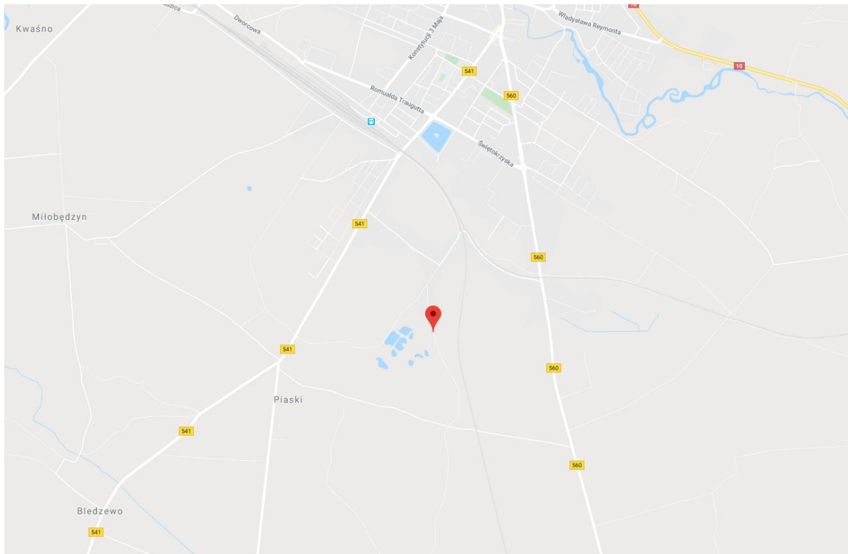
Rys nr 1 – Lokalizacja opracowania