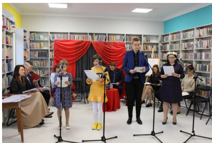
fot. Narodowe Czytanie „Balladyny”