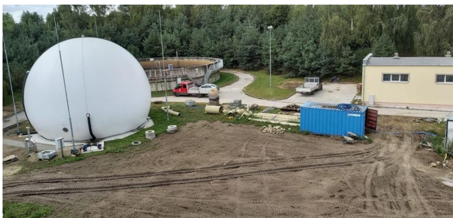
fot. Zbiornik biogazu