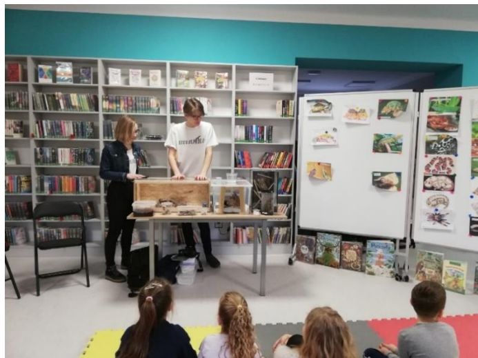
Fot. Zajęcia z udziałem uczniów Leonium „Egzotyka zimą”