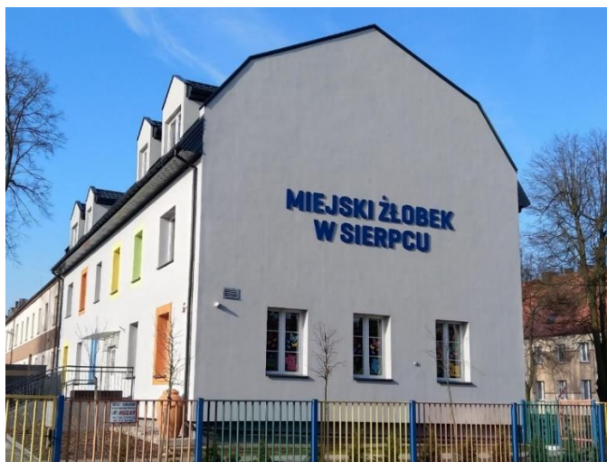
foto. Budynek Miejskiego Żłobka

W roku sprawozdawczym wpłynęło ich do placówki 25. Niestety z uwagi na ograniczenia lokalowe jesteśmy w stanie przyjąć około 12 nowych dzieci rocznie.