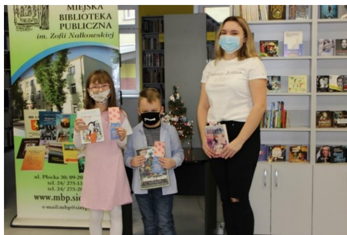
Fot. Wręczenie nagród w konkursie na najlepszego czytelnika