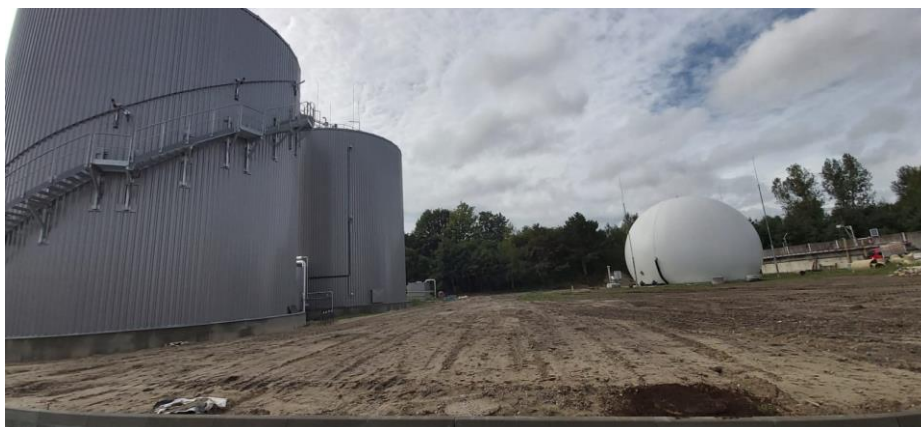
fot. Zamknięte komory fermentacyjne

Natomiast w ramach modernizacji systemu sterowania kontynuowano budowę instalacji sterowania w nowym układzie związanym z zagospodarowaniem osadów oraz produkcją biogazu obejmującą wprowadzenie nowych układów pomiarowych wraz ze sterowaniem i nowym interfejsem umożliwiającym obrazowe kontrolowanie przebiegu procesu. Jednym z efektów modernizacji Miejskiej Oczyszczalni Ścieków było wyłączenie z eksploatacji zakładowej kotłowni węglowej, którą zastąpiło ciepło odpadowe z kogeneratora. Poza wyżej wymienionym zakresem przebudowano również układ elektroenergetyczny oczyszczalni oraz wymieniono zużyte urządzenia i linie kablowe zapewniające zwiększone potrzeby w zakresie zasilania docelowo rozbudowywanej oczyszczalni oraz możliwość ewentualnej sprzedaży nadwyżek energii elektrycznej do sieci zawodowej. W roku 2020 realizowano ostatnie zadanie z rozszerzonego zakresu rzeczowego i finansowego projektu tj. budowę odgałęzień sieci kanalizacji sanitarnej w ul. 11-go Listopada i Kilińskiego. Planowany całkowity koszt realizacji projektu wynosi 28 344 817,00 zł. Maksymalny koszt wydatków kwalifikowanych 17 118 796,00 zł. i kwota dofinansowania 14 550 976,00 zł. Planowany termin zakończenia realizacji inwestycji to II kwartał 2021, natomiast termin osiągnięcia efektu ekologicznego – przetwarzanie rocznie 540 ton suchej masy osadów ściekowych i podłączenie 249 dostawców ścieków, to IV kwartał 2021.