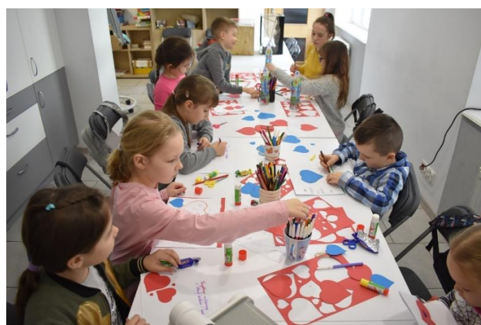
Fot. Zajęcia plastyczne w ramach akcji „Zima w mieście”