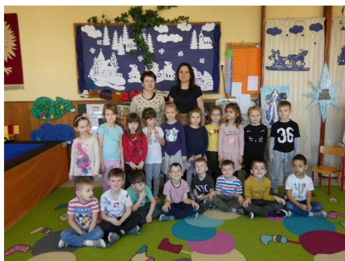
Fot. „Czytanie na dywanie”