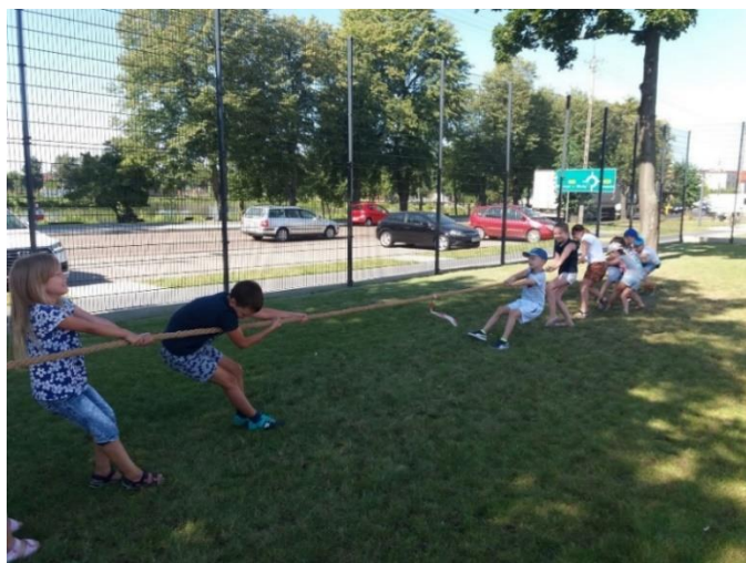
Fot. Zajęcia sportowe w ramach akcji „Lato w mieście”