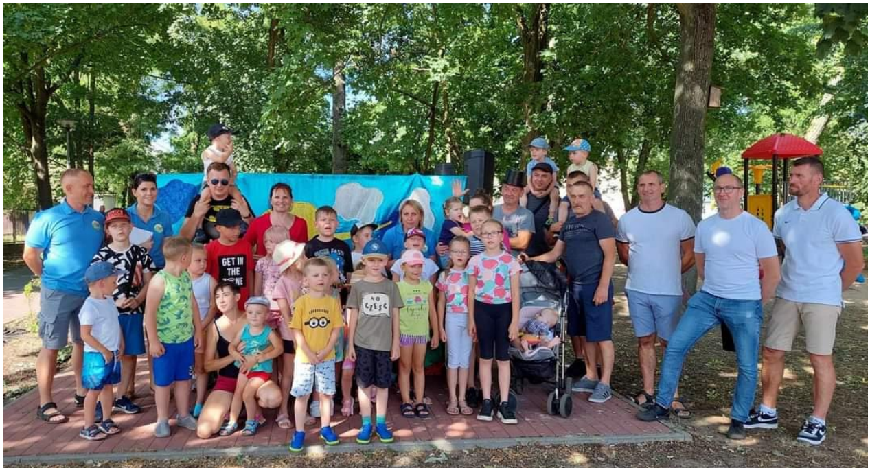
Rysunek 7 Powitanie lata w parku Andersa.