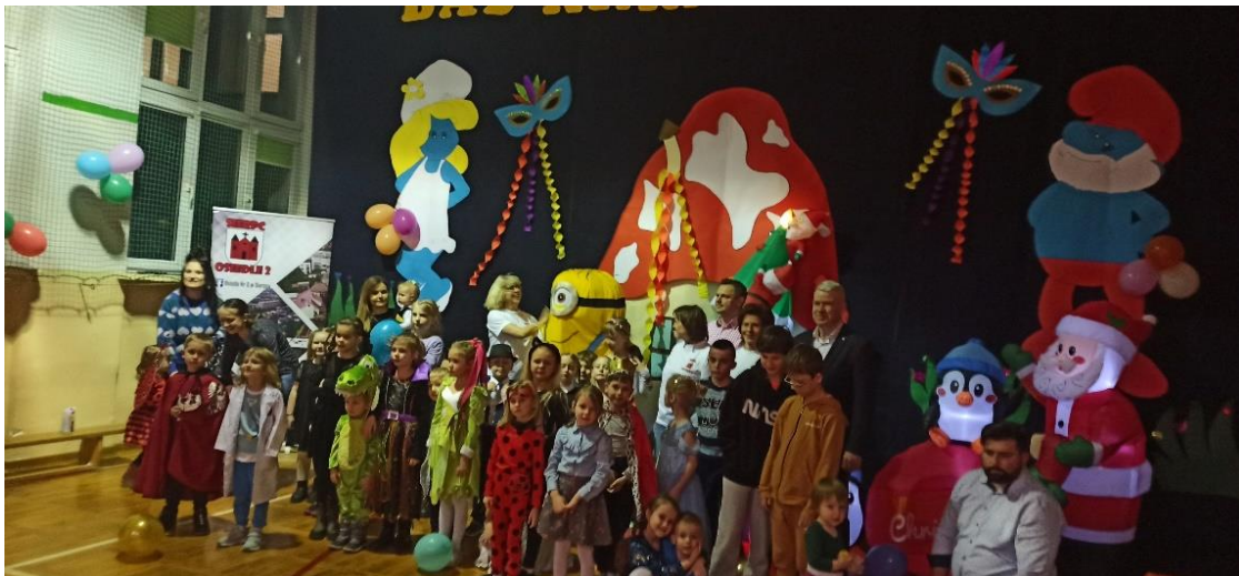
Rysunek 5 Choinka osiedlowa Zarządu Osiedla nr 2

Osiedle nr 2 prowadzi fanpage na Facebooku , gdzie zamieszczane są aktualne informacje w formie plakatów i zaproszeń o planowanych wydarzeniach, imprezach osiedlowych oraz okolicznościowe kartki i życzenia. Nowe ogłoszenia (wiadomości) są udostępniane i przegląda je liczna grupa osób (ok. 3000 osób i więcej). Dzięki uprzejmości dyrekcji szkoły, przedszkola i biblioteki miejskiej, plakaty są rozwieszane w: Szkole Podstawowej Nr 3, Przedszkolu Nr 2, Filii Biblioteki Miejskiej oraz w miejscach użyteczności publicznej. Ponadto, przesyłane są do publikacji artykuły i zdjęcia z działalności Osiedla do miejskiego biuletynu „Nasz Sierpc”. Na każdą imprezę osiedlową zapraszane są i goszczą lokalne media „Ekstra Sierpc”.