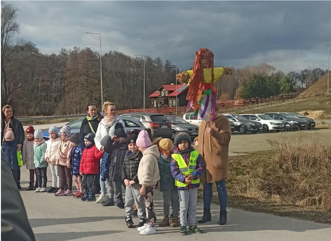
Rysunek 6 Grupa przedszkolaków na ulicy Bobrowej podczas topienia Eko Marzanny.