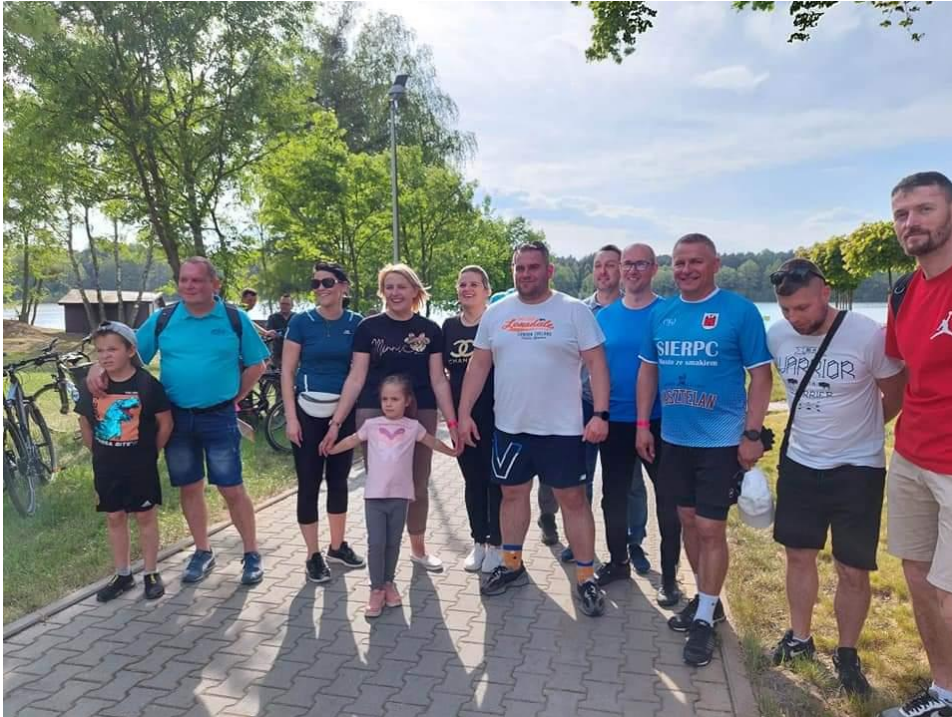
Rysunek 8 Rowerowa majówka.