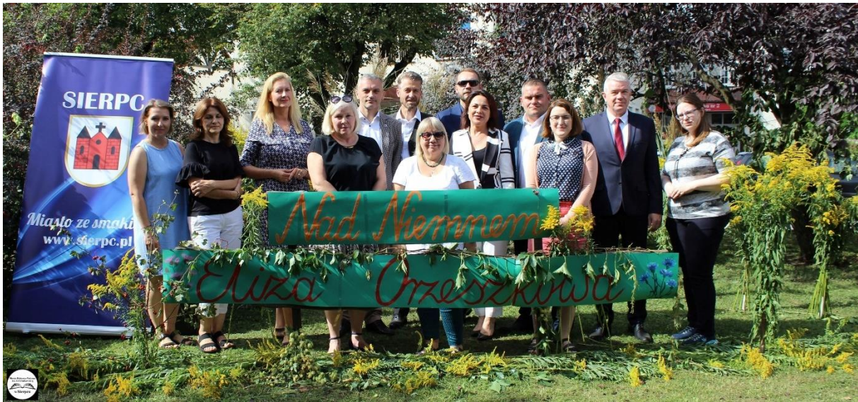
Rysunek 4 Narodowe Czytanie 2023.