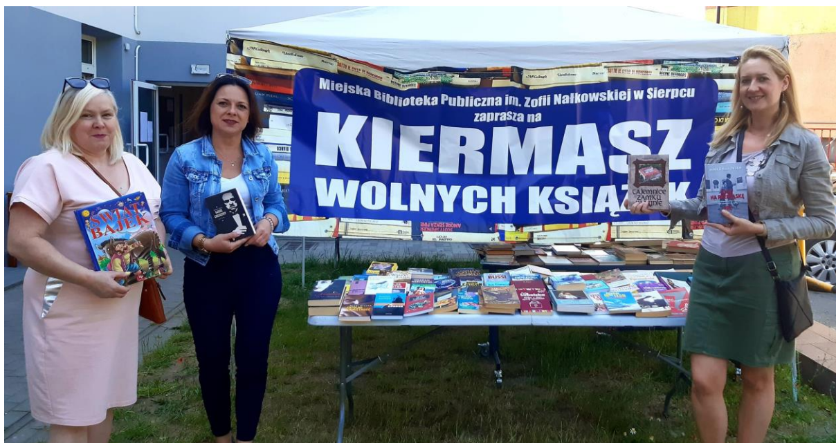
Rysunek 3 Kiermasz wolnych książek